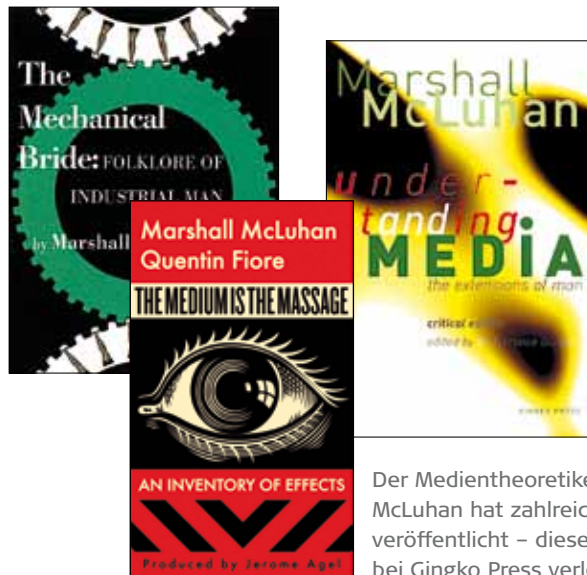
Der Medientheoretiker Marshall McLuhan hat zahlreiche Bücher veröffentlicht – diese drei werden bei Gingko Press verlegt.